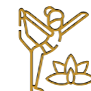
Parque Yaxkim (Zen/Yoga) Significa Sol naciente