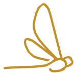
Parque Turix Significa Libélula

A esto sumándole los parques temáticos que tendrá todas las privadas.