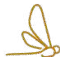
Parque Turix Significa Libélula