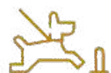
Parque Peek (Mascotas) Significa Perro