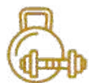
Parque Kabáh (Acondicionamiento Físico) Significa Mano dura