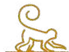
Parque Maax Significa Mono