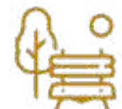
Parque Kante (Contemplación) Significa Árbol