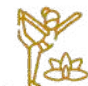
Parque Yaxkim (Zen/Yoga) Significa Sol naciente