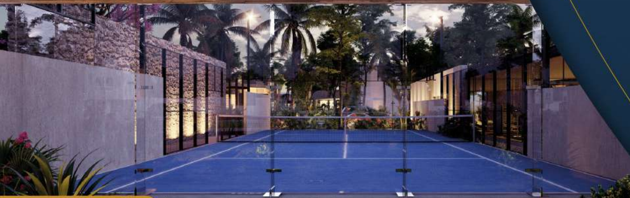
CANCHA DE PÁDEL