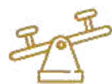
Parque Nuscaa (Infantil) Significa Tierra nueva