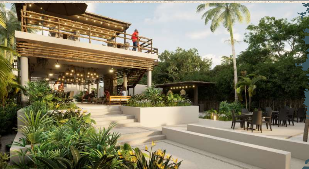
ESTAS IMÁGENES SON DE CARÁCTER ILUSTRATIVO, PUEDEN VARIAR EN EL DESARROLLO DEL PROYECTO SIN NINGUNA RESPONSABILIDAD PARA EL DESARROLLADOR