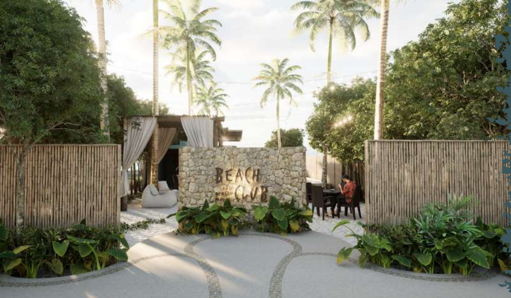
ESTAS IMÁGENES SON DE CARÁCTER ILUSTRATIVO, PUEDEN VARIAR EN EL DESARROLLO DEL PROYECTO SIN NINGUNA RESPONSABILIDAD PARA EL DESARROLLADOR